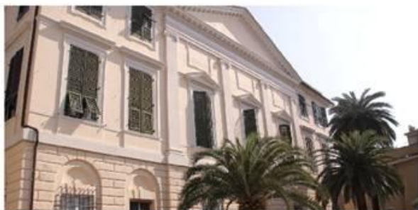
Sopra, fotografie delle ville aperte oggi a Sampierdarena

Progetto grafico a cura di Sara Guagliardi e Alise Tricani